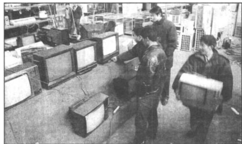
货源充足的旧货市场满足了不同层次的消费者。