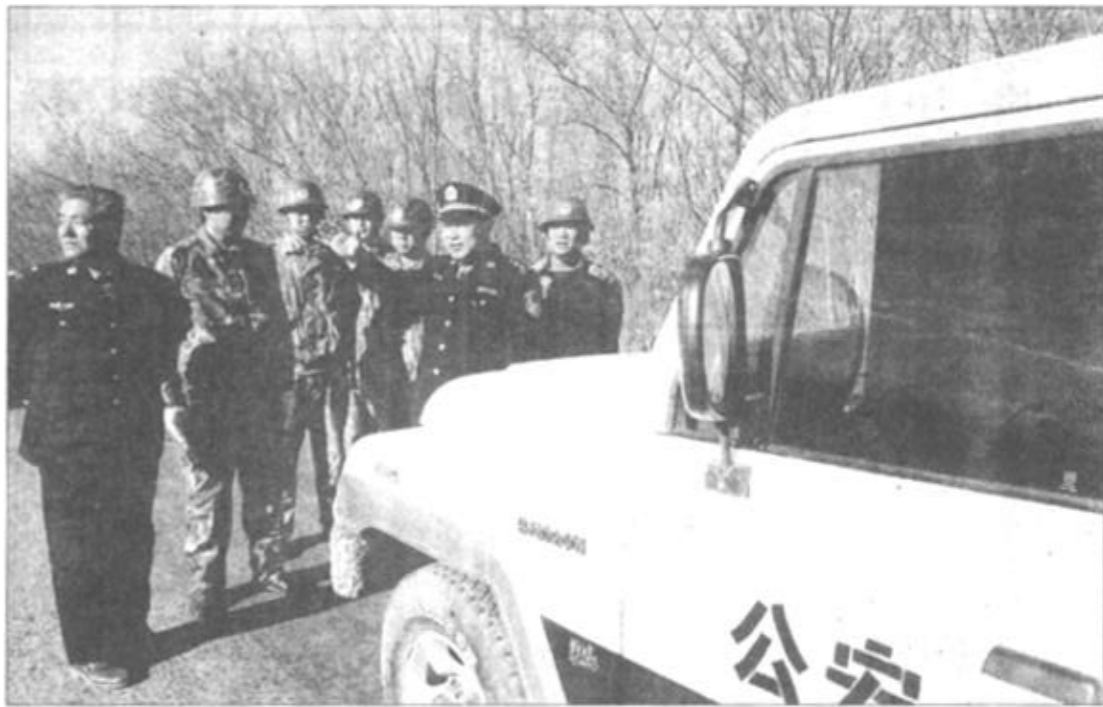
市林业局林业公安处采取严密措施,加大冬季森林防火力度。图为工作人员正深入一线部署防火工作。