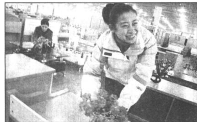
营业面积30000平方米的黄河口家具广场已入住商户近百家，安置再就业职工160多人。