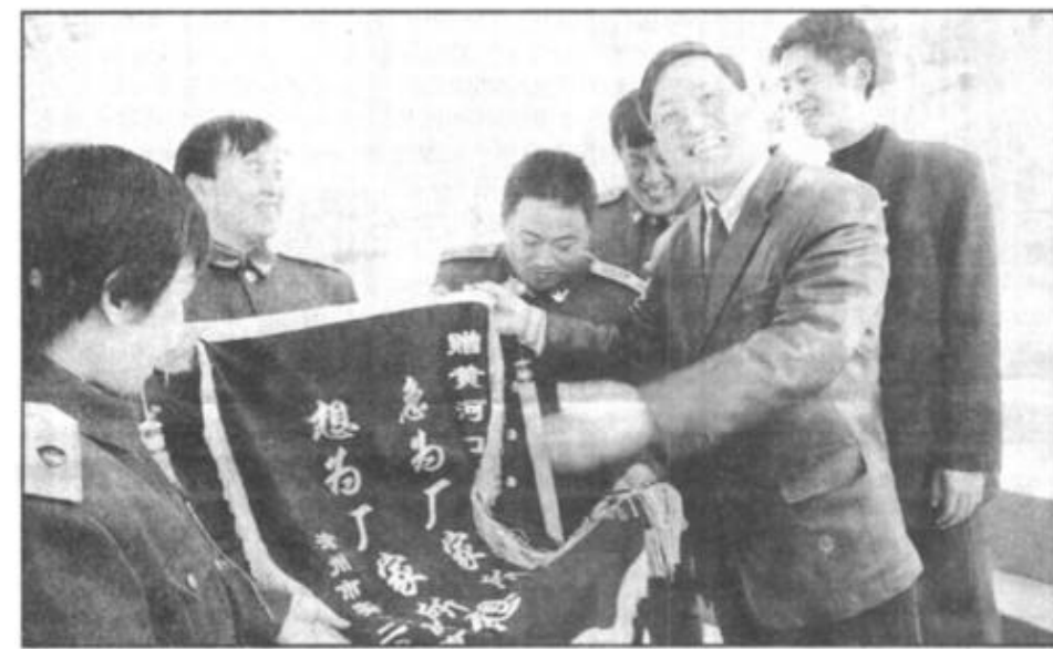
优质的服务赢得了商户的真诚回报。