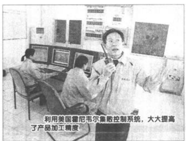
利用美国霍尼韦尔集散控制系统,大大提高了产品加工精度